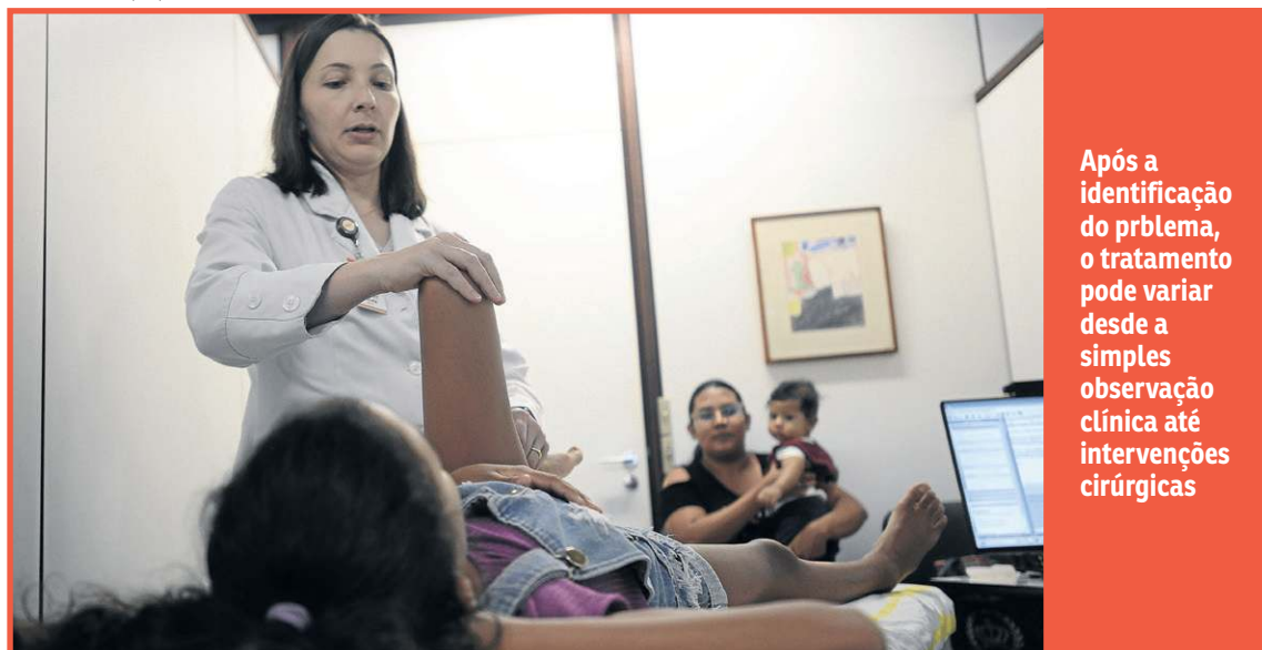
Após a identificação do problema, o tratamento pode variar desde a simples observação clínica até intervenções cirúrgicas

eram um desafio. “Ela não conseguia usar sapato fechado, porque os pezinhos batiam um no outro.”